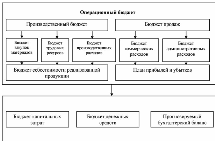
Рисунок 2. Схема разработки главного бюджета организации.

деления предприятия, которые разрабатывают бюджеты по направлениям, на основании которых готовятся бюджеты налогов, прибыли, наличных денежных средств, а также прогнозный баланс.